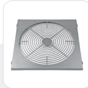
Rejilla de acero inoxidable (sin pinturas)